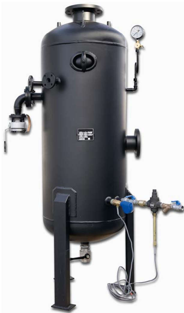
Рисунок носит указательный характер